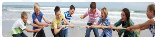
Forskningsgruppen Børn og Unge