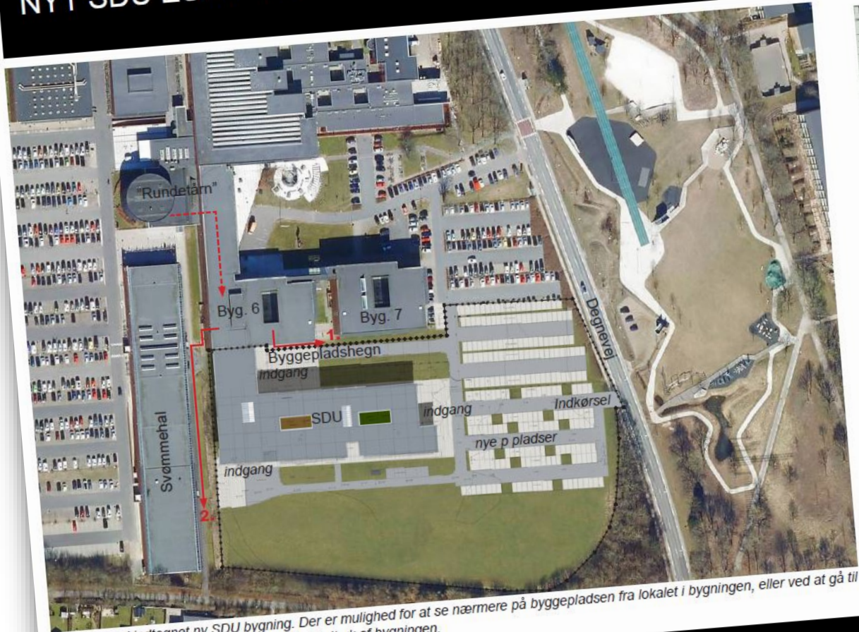
Luftfoto med indtegnede nye SDU bygning. Der er mulighed for at se nærmere på byggepladsen fra lokalet i bygningen, eller ved at gå til punkterne 1. eller 2., hvorfor man kan få et indtryk af bygningen.