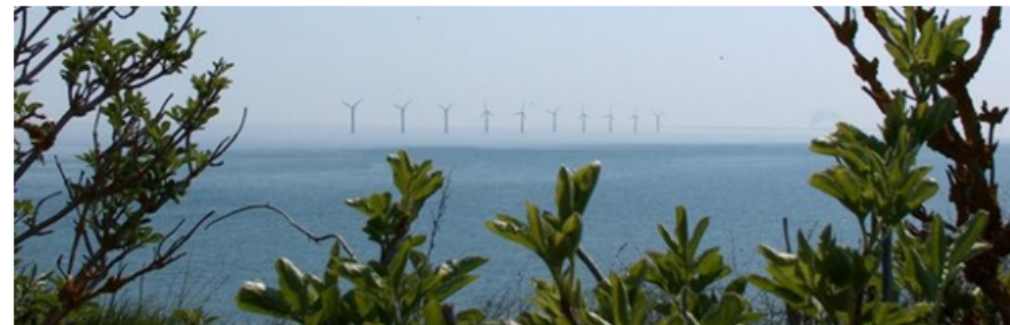
Bovbjerg Fyr - lige til kanten har opdateret sit coverbillede. 12. maj · 🌐

Et bredt samarbejde på Samsø har på otte år formået at omstille øens energiproduktion fra olie og kul til vedvarende energi. Lokalt engagement har skabt en slags social energibevægelse. I dag producerer øen mere ren energi, end den forbruger, og sender den overskydende energi til fastlandet. Samsø har nu en international førerposition som energirigtig forskningsø, hvorfra Samsø EnergiAkademi deler viden og erfaringer med resten af verden.