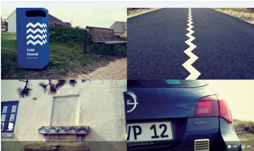
Cold Hawaii - to byer, én bølge...