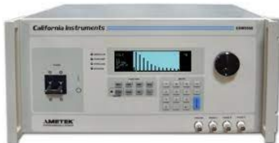
AC Power Source

Derudover er der krav om el-sikkerhedskursus EN50110-1.