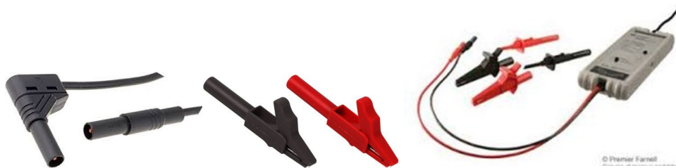
Isolerede laboratoriestik/krokodillenæb og isoleret differentialprobe

Hvis forsøget ikke kan gennemføres med isolerede dele, skal arbejdsmiljøgruppen kontaktes, og arbejdsmiljøgruppen skal godkende risikovurdering, procedure/instruktion og foranstaltninger.